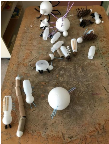
Création des insectes par assemblage