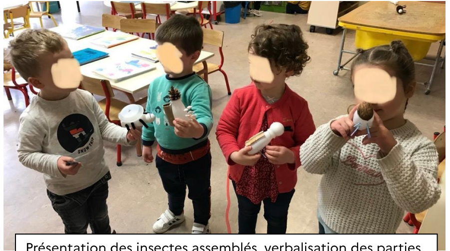
Présentation des insectes assemblés, verbalisation des parties du corps de l'insecte. Projection sur sa coloration.