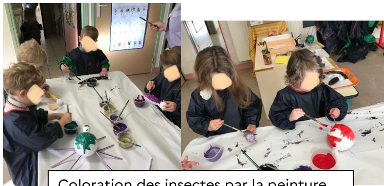
Coloration des insectes par la peinture.