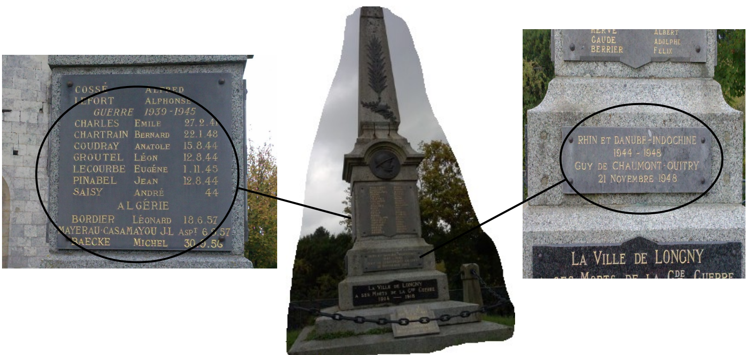
Monument aux morts de Longny au Perche

Des plaques avec les photos des disparus sont parfois apposées au monument. Certaines communes ont ajouté à cette première liste établie après la Première Guerre mondiale (1914-1918), les noms des morts des conflits qui ont suivi : Seconde Guerre mondiale (39-45), Guerre d'Indochine, Guerre d'Algérie.