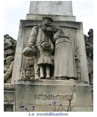
Monument aux morts de la Ferté-Macé

- La présence d'une femme, d'un homme ou d'un enfant témoigne de la peine de toutes les familles. Ils sont souvent habillés en vêtement de travail ou en costume traditionnel de la région.