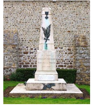
Monument aux morts de Moussonvilliers

C'est le plus ancien monument érigé à caractère funéraire. Sa forme tend à rapprocher le défunt vers le ciel. Les pierres levées sont des hymnes à la vie.