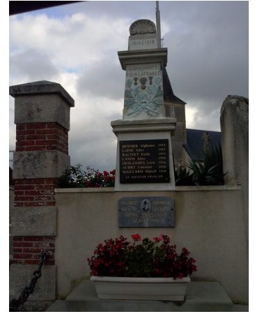
Monument aux morts de Neauphe sous Essai

-Un obus enchaîné ne peut plus servir à faire la guerre. On peut y voir le symbole de la paix retrouvée.