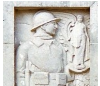
Monument aux morts de Bellême

- Dans certaines régions très catholiques, on retrouve des personnages religieux (le Christ, la Vierge et les anges) malgré la loi de 1905 interdisant tous signes religieux sur les monuments publics. Ces monuments sont souvent construits près de l'église ou dans le cimetière.