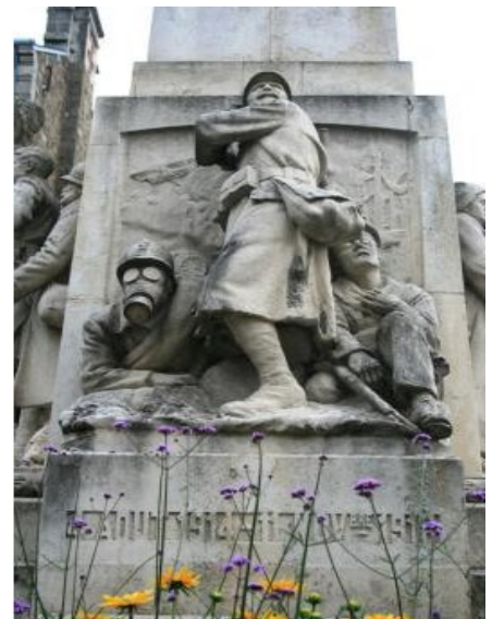
Monument aux morts de la Ferté-Macé

Des objets, tels que les casques, médailles, armes, fils barbelés, masque à gaz, etc. , nous rappellent l'horreur de la guerre.