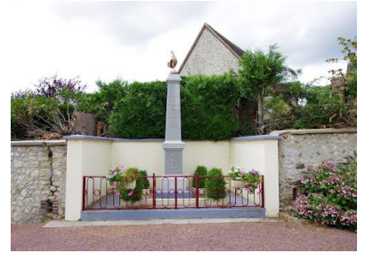
Monument aux morts de Lignerolles

-Le coq représente le courage et la fierté. C'est un animal de combat. Son chant qui annonce le lever du jour, symbolise la vie ranimée après le sommeil.