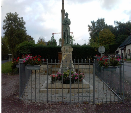
Monument aux morts de Saint Gervais du Perron