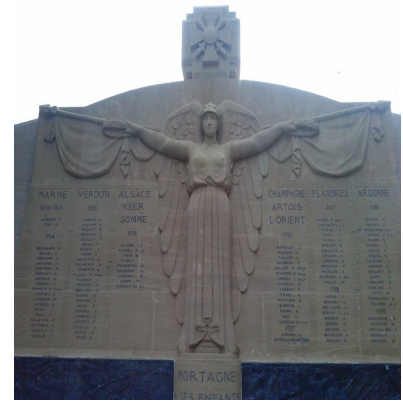
Monument aux morts de Mortagne au perche

- Une femme avec des ailes représente la gloire, la victoire, la patrie, la nation, la liberté, ... Seule, elle rappelle la cause du sacrifice. Elle peut également soutenir ou récompenser un soldat.