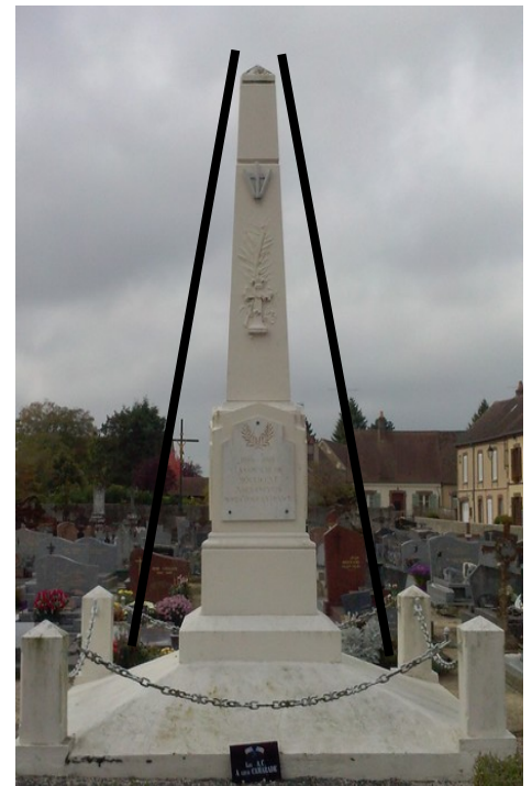
Monument aux morts de Moulicent

Les monuments ont souvent la forme d'une pyramide ou d'un obélisque. La plupart du temps, on y trouve une palme et une croix de guerre au sommet.