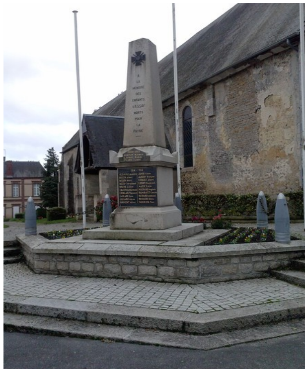
Monument aux morts de Essai