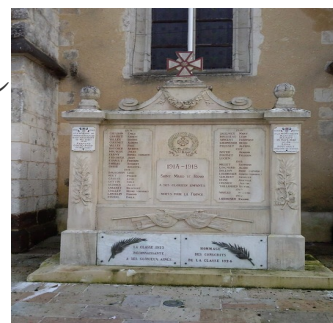
Monuments de Saint Mard de Réno