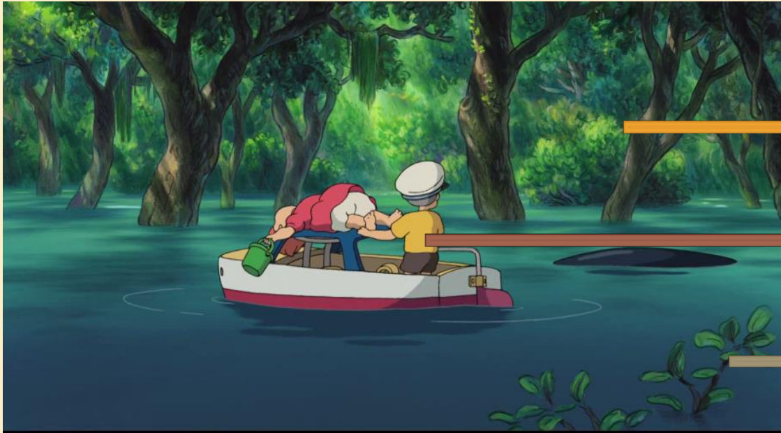
Image tirée du film : Ponyo sur la falaise , Hayao Miyazaki (2008)