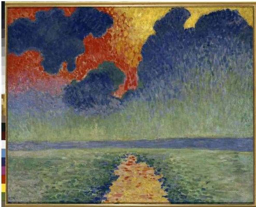
André Derain, Effets de soleil sur l'eau , Londres, 1905, huile sur toile