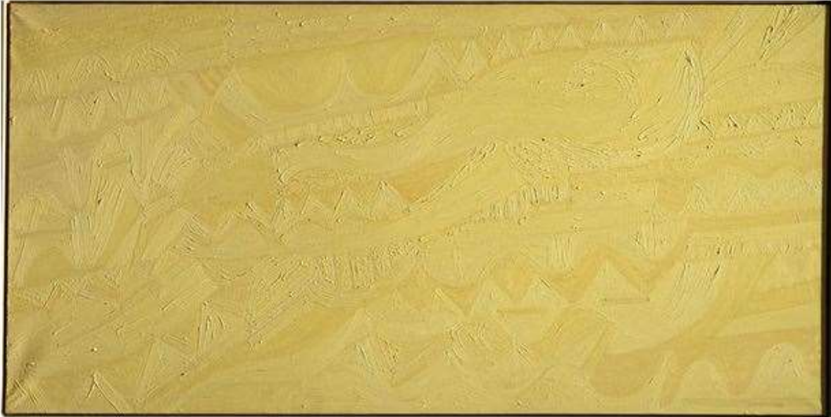
Serge Charchoune, Gabrielli variation II , 1968, huile sur toile