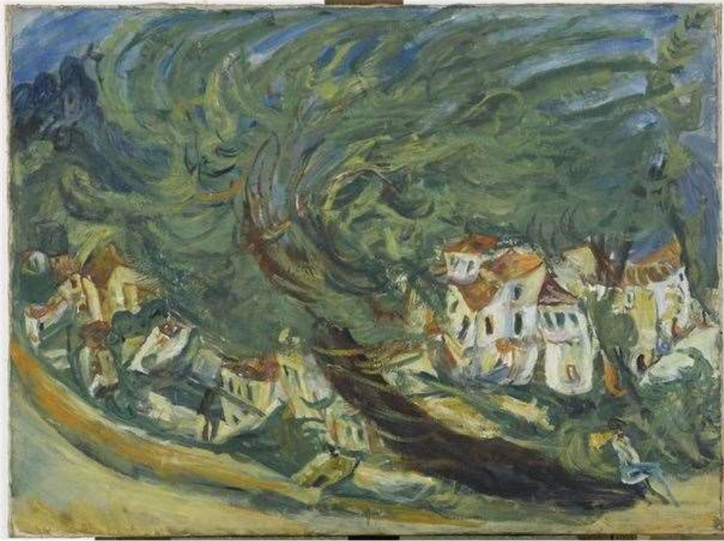
Chaim Soutine, Arbre couché , 1923-1924, huile sur toile