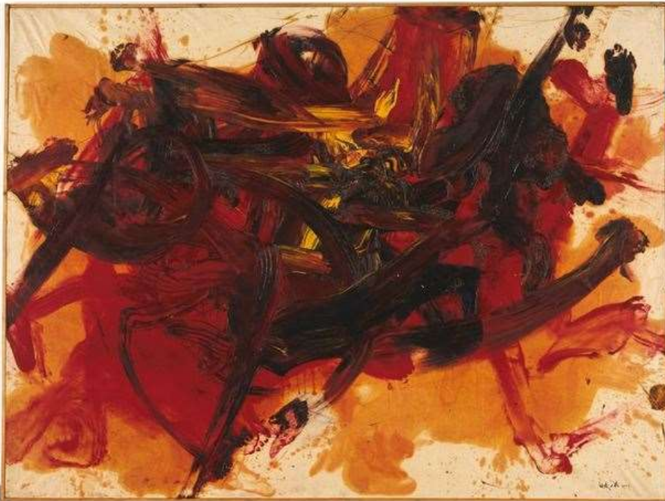
Shiraga Kazuo, Sans titre , 1957, aquarelle, encre de chine, huile sur papier, marouflage