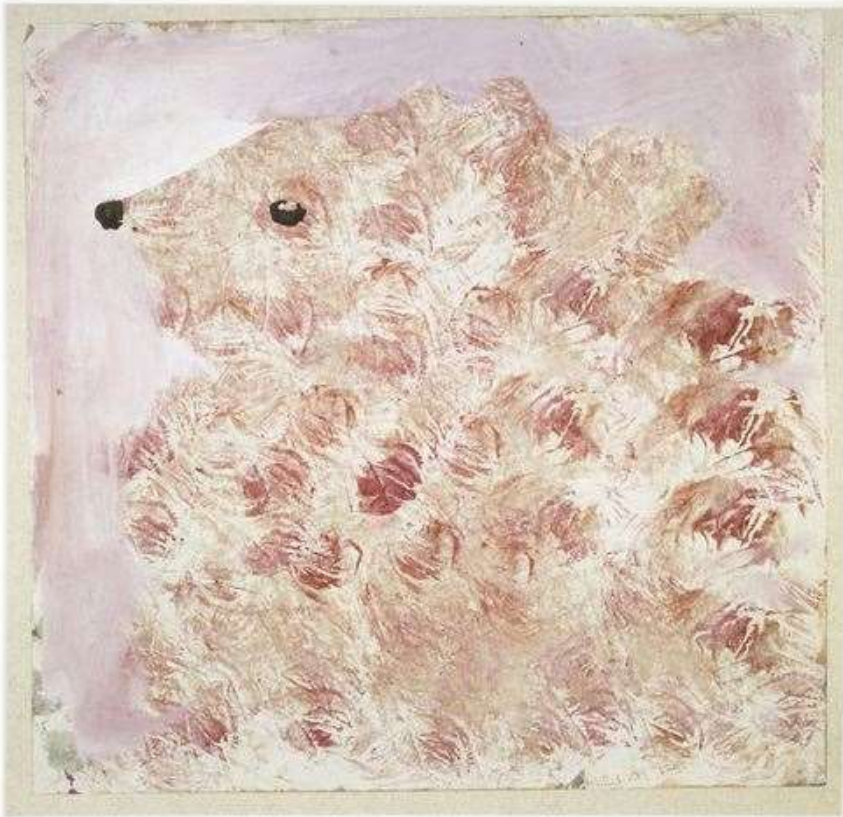
Eugène Gabritschewsky, Luce le chien , vers 1947-48, gouache