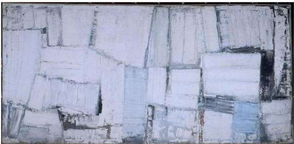
Olivier Debré, Le mur blanc ou la famille , 1950, huile sur toile