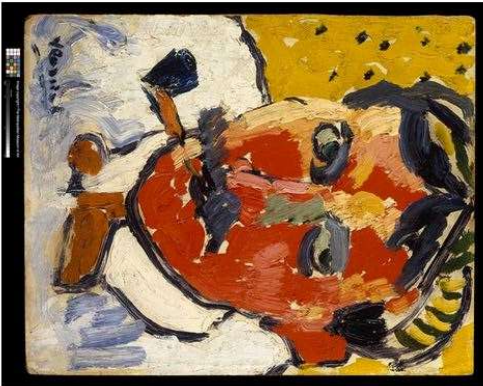
André Derain, Maurice de Vlaminck , 1906, huile sur carton