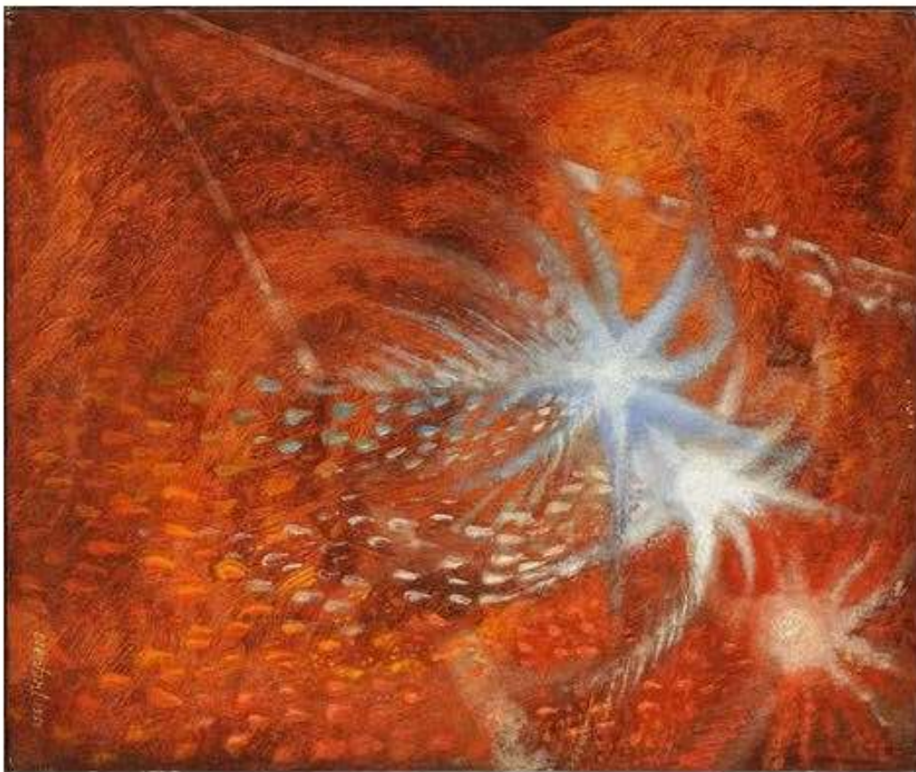
Amédée Ozenfant, Feu d'artifice , 1955, huile sur toile