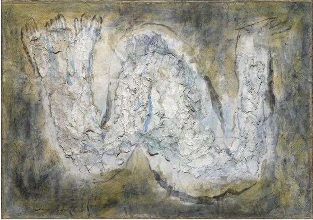
Jean Fautrier, L'écorché , 1944, huile sur papier, marouflage, toile textile