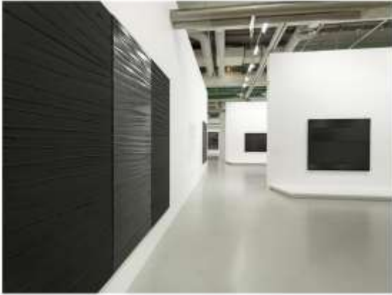
Vue de l'exposition de Pierre Soulage au Centre Pompidou, 2009-2010