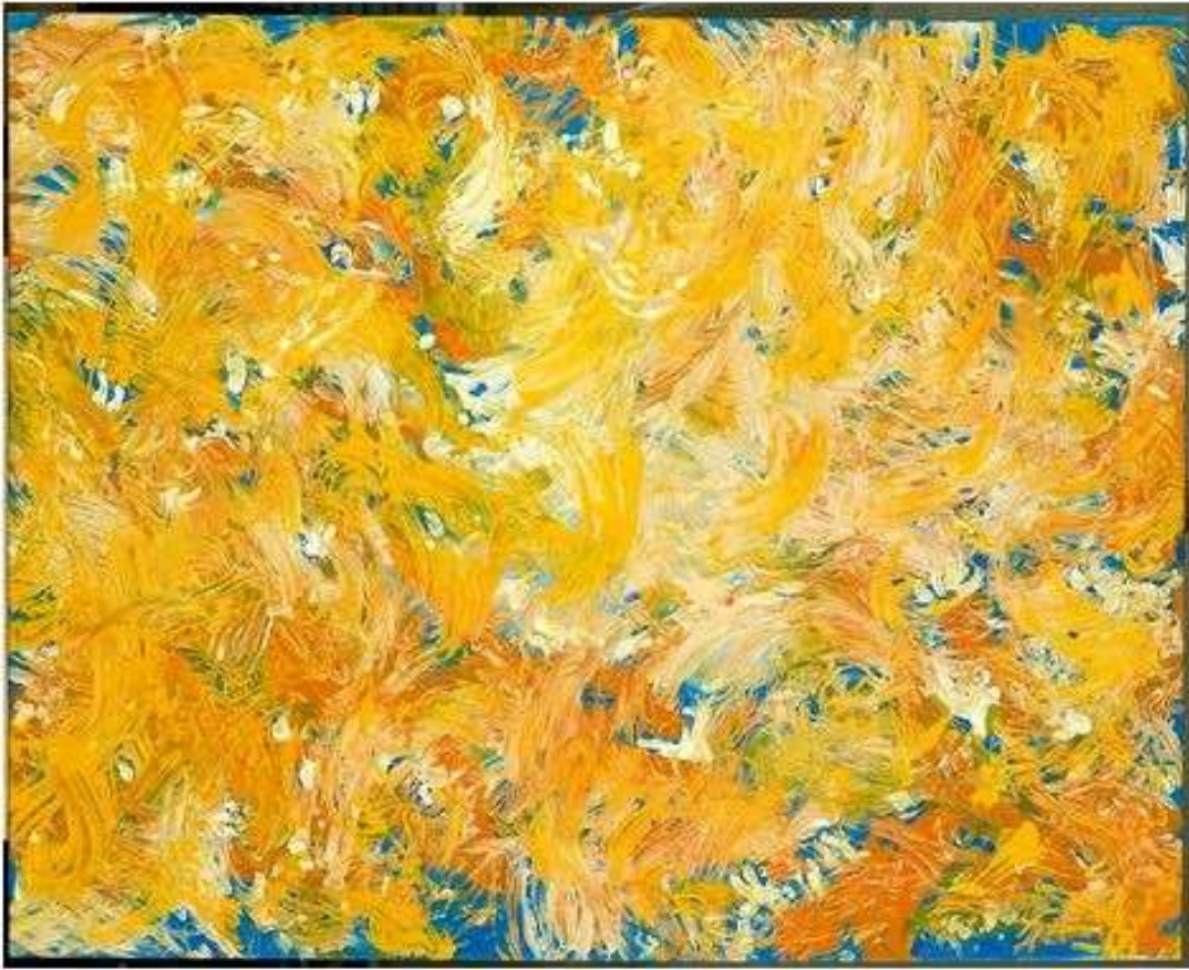
Jacques Bruel, Quantum d'affect II , 1981, peinture acrylique sur toile