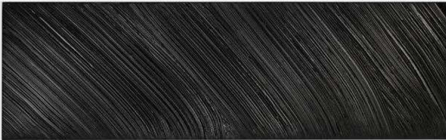
Pierre Soulage, Peinture 51 x 165, 1985, huile sur toile