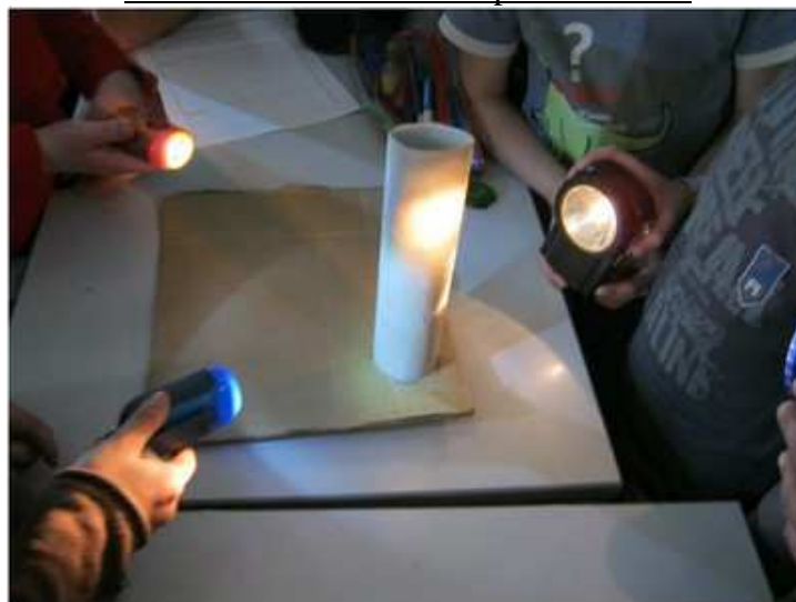
Photo réalisée lors de l'expérimentation