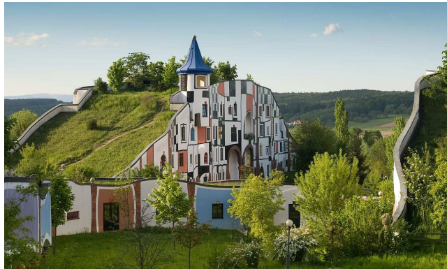
Village thermal de Blumau

Ses constructions hautes en couleurs sont inspirées de Gaudi. Ses façades sont multicolores, les formes sont audacieuses : courbes, spirales, toits recouverts de verdure, arbres locataires, coupoles.