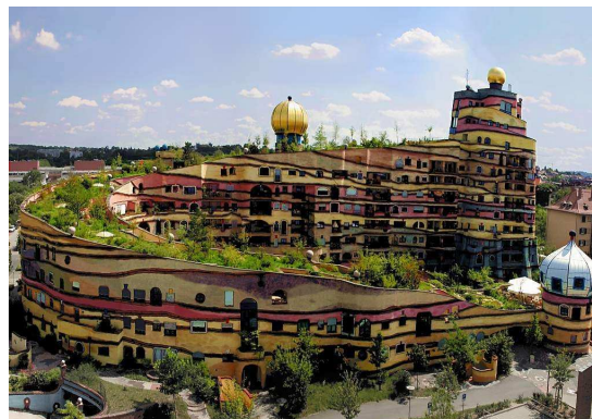
Waldspirale à Darmstadt