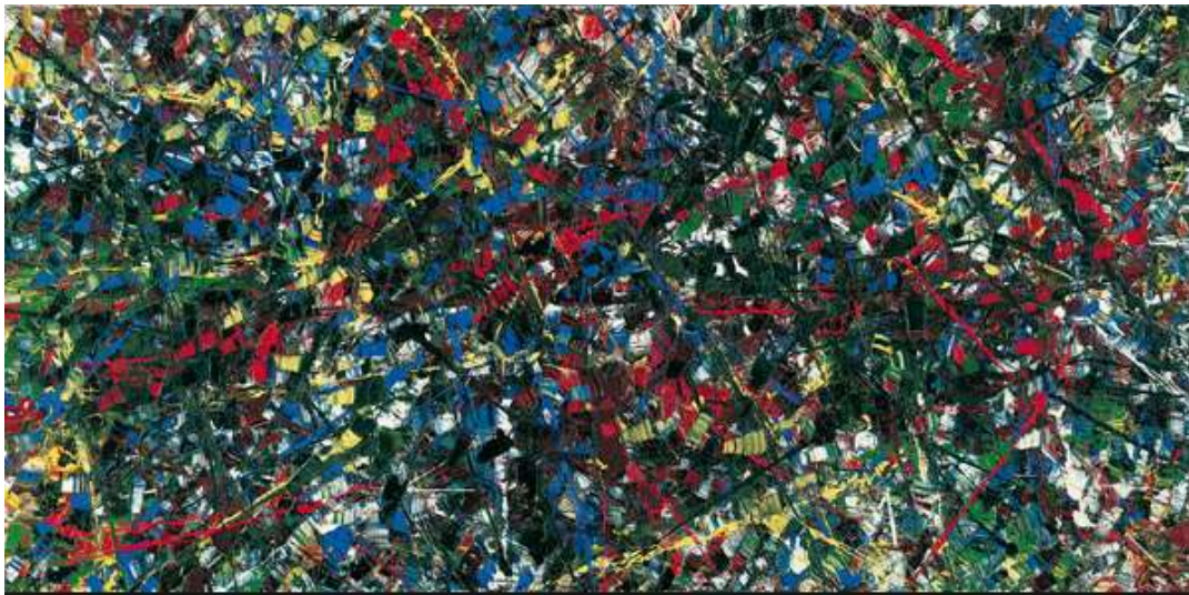
Jean Paul Riopelle, 1958, Sans Titre

Cette vidéo est très bien sur le dripping : https://www.youtube.com/watch?v=JZ3gIUyHa3Q&t=2s mais la musique est trop présente.