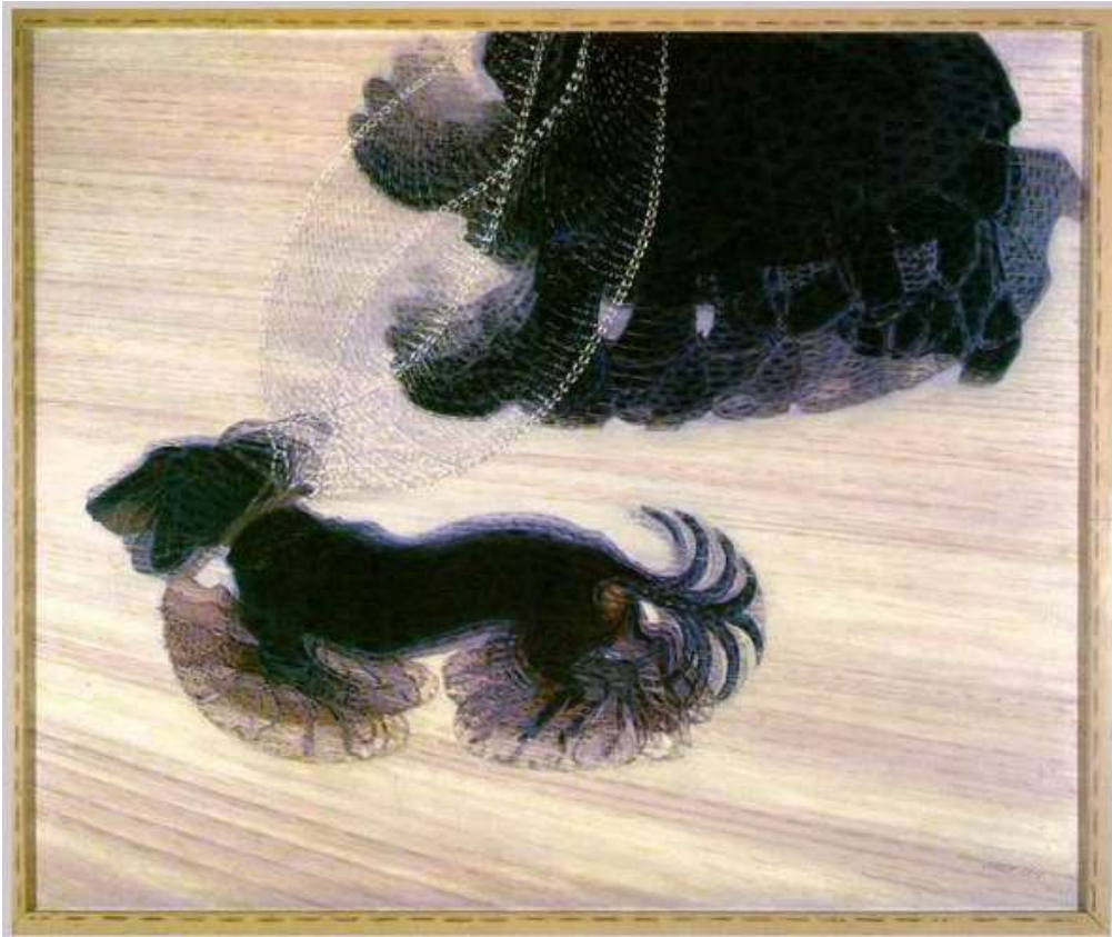
Giacomo Balla, Dynamisme d'un chien en laisse , 1912